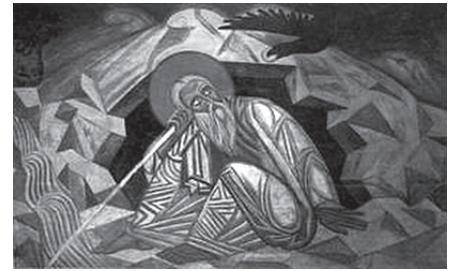
М. Бойчук «Пророк Ілля» (1913)

Бойчука, якого арештували у 1936 році, звинувачували в «українській контрреволюційній націонал-фашистській діяльності, метою якої було від-