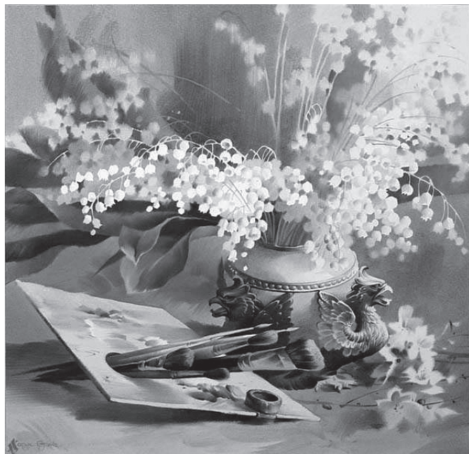
«Конвалії», акварель. Художники брати О. та С. Харуки

З найтеплішими вітаннями, колектив планово-фінансового відділу, адміністративно-управлінський персонал та науково-педагогічний колектив НТУ